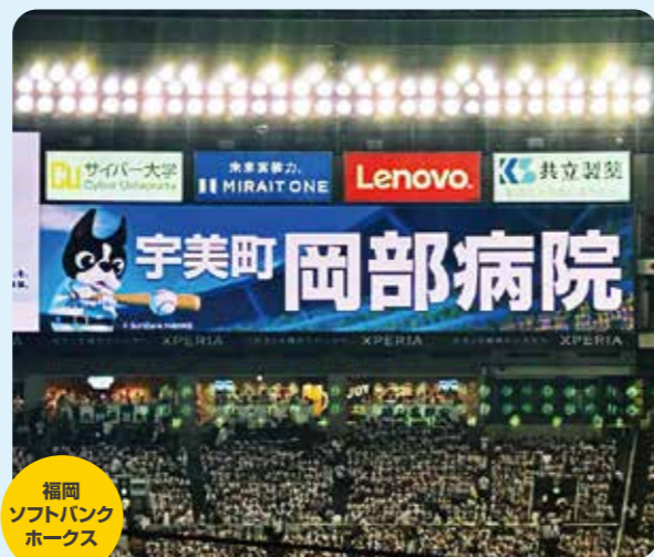
福岡 ソフトバンク ホークス